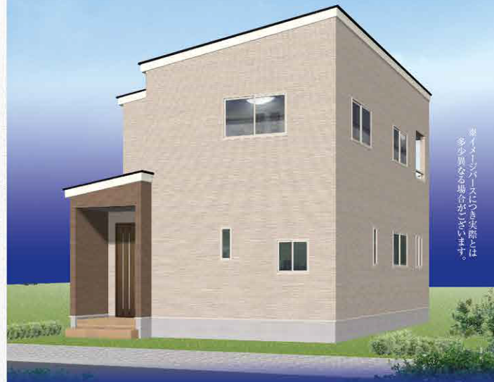
※イメージイラストにつき実際とは 多少異なる場合がございます。

生活動線を意識して考えられたプランニングにより、家族が 快適に過ごせる住宅が誕生します。家族の成長を見守り続 ける長期保証付き住宅で家族と共に末長く暮らしませんか？